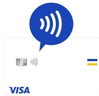
Visa のタッチ決済対応カードの目印

本実証実験では、レシップが提供するキャッシュレス運賃収受器「LV-700」を車内に設置し、乗車時にお客さまがお持ちの Visa のタッチ決済に対応したカードまたはスマートフォン等を同収受器にかざすだけで決済が完了し、バスにご乗車いただけます。