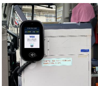
タッチ決済に使用する「LV700」の設置イメージ

ご乗車時に乗務員にご申告の上、バス車内に設置する Visa のタッチ決済用の端末機に、Visa のタッチ決済対応カードまたはスマートフォン等をかざすことでご利用いただけます。